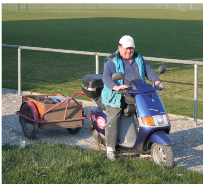
Heinz als Brotzeit- Lieferant beim Sportheimbau