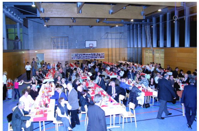
Blick von der Bühne