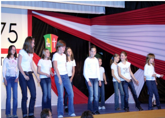
Jugend - Turngruppe