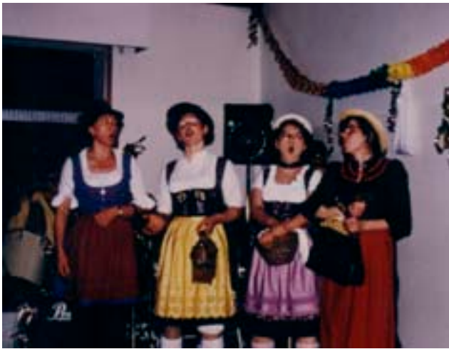
1994 - Sketch: Moritat vom Mann