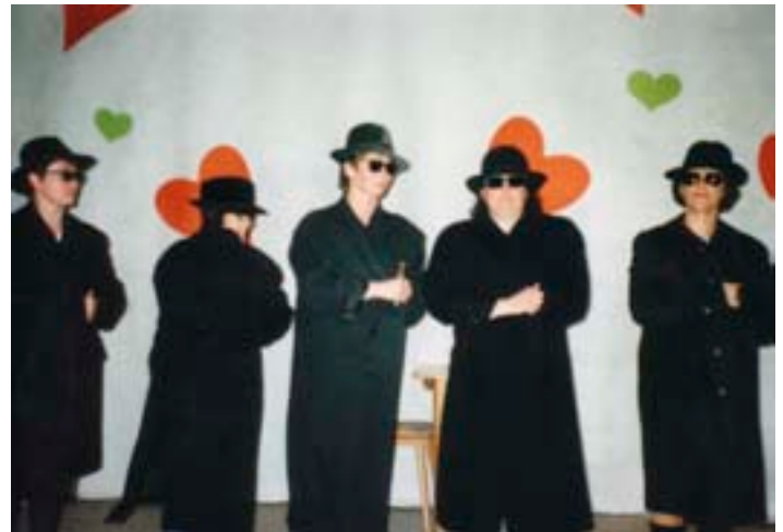
1999 – Einlage: Feinripp