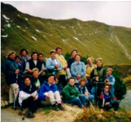
1998 – Bergtour Kanzelwandhaus