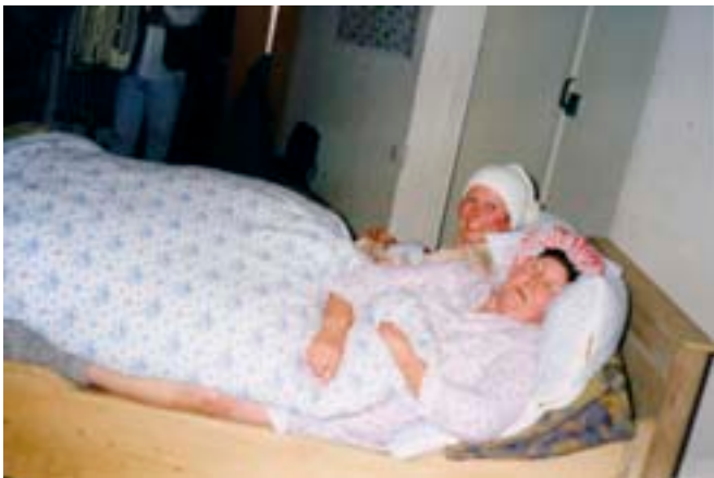
1998 – Sketch: D' Wechseljahre