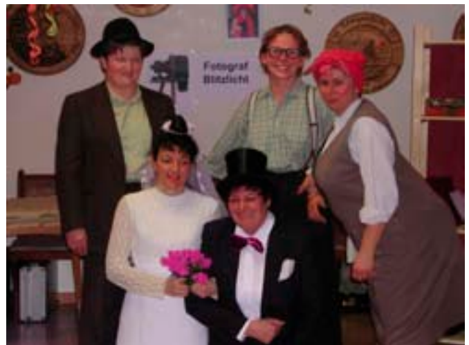
2006 – Sketch: Fotograf Blitzlicht