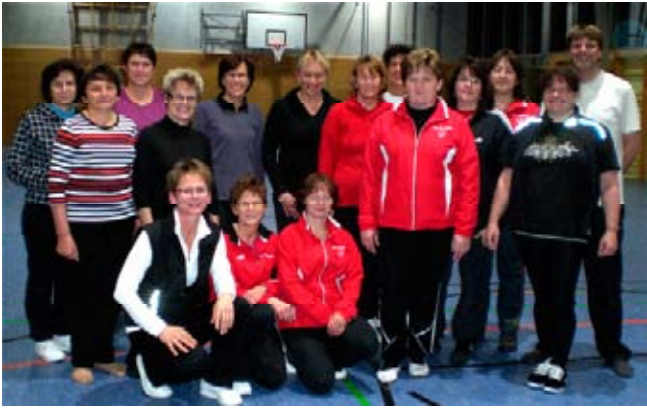
Text und Fotos: Wieser Karola, Abt. Ltg. Turnen

am Ende des Kurses angeregt, dass im nächsten Jahr eine Wiederholung bzw. Fortsetzung stattfinden sollte.