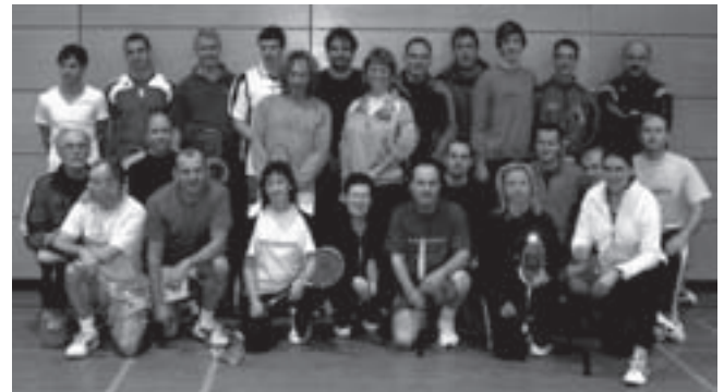
Bild der Teilnehmer beim 6. Schleifen Turnier