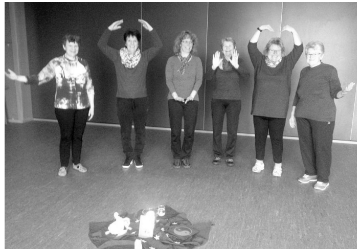
Übungshaltungen von unserem geliebten Herz Qi Gong.