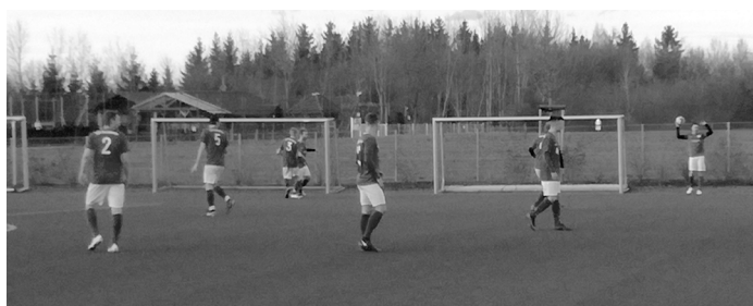
Testspiel der 1. Mannschaft gegen den BC Schretzheim

Aufgrund des meist recht ordentlichen Wetters konnte die Vorbereitung fast planmäßig durchgeführt werden. Die Trainingsbeteiligung war größtenteils in Ordnung. Die 1. Mannschaft absolvierte die ersten beiden Testspiele auf Kunstrasen. Einer 2:3 Niederlage gegen den TSV Pfersee in Batzenhofen folgte ein spielfreies Faschingswochenende. In Wertingen trennte sich die erste Elf anschließend mit 1:1 vom BC Schretzheim. Die weiteren Vorbereitungsspiele zu Hause gegen den SC Unterrieden und den SV Schlingen waren bei Berichtsabgabe noch nicht ausgetragen. Ebenso fand auch das Trainingslager im Spreewald (Lübben) erst nach Anzeigenschluss statt.