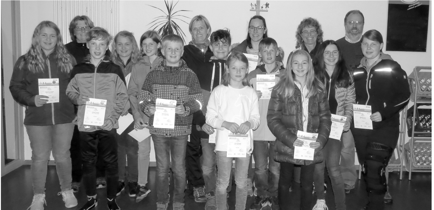
Sportabzeichenübergabe von 2018