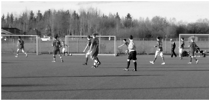
Testspiel der 2. Mannschaft gegen den BC Schretzheim 2

Unsere beiden Mannschaften mit den jeweiligen Trainern wünschen wir in der Rückrunde viel Erfolg, gute Kameradschaft sowie eine verletzungsfreie Zeit. Bedanken möchte ich mich bei allen Zuschauern, Sponsoren und ehrenamtlichen Helfern der Abteilung Fußball.